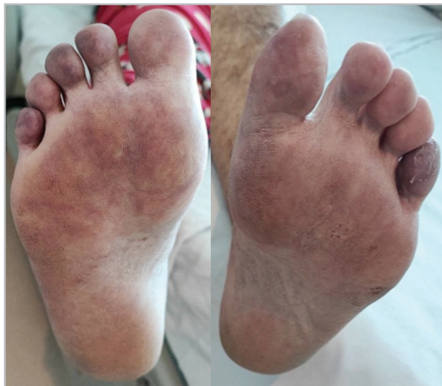
Figura 1. Coloración violácea de los dedos y región plantar distal de ambos pies.

posibilidad de una glomerulonefritis rápidamente progresiva (GNRPG), se decidió realizar biopsia renal que confirmó una NTI con daño tubular agudo asociado y se descartó la GNRPG (Figura 2). En el contexto clínico, este hallazgo se interpretó como secundario a ateroembolia renal, lo que explicaba la positividad de los ANCA, la eosinofilia periférica, los hallazgos cutáneos y la NTI. No se logró identificar en la muestra examinada los émbolos de colesterol.