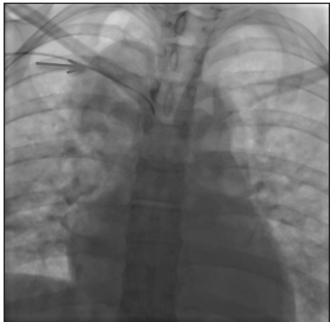
Figura 2. Cavografía.