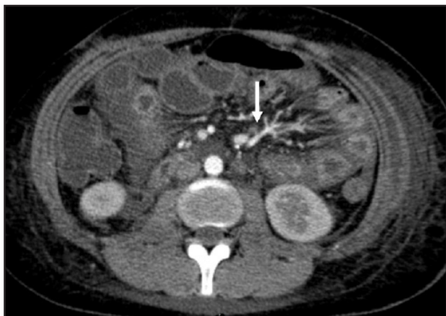
Figura 1. La flecha señala el signo del peine.

DOI: https://doi.org/10.36104/amc.2021.2054