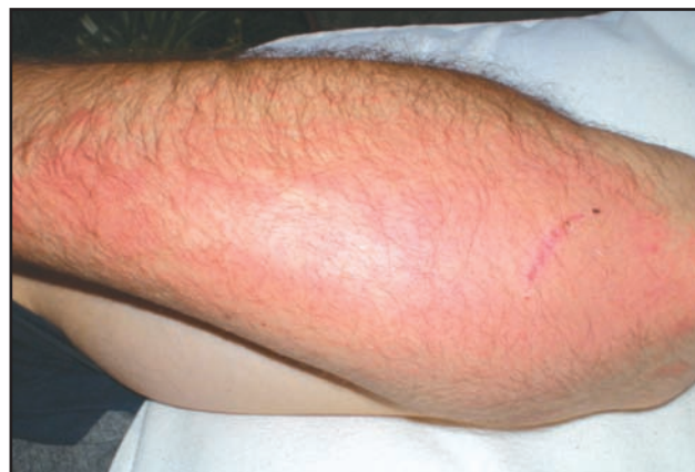
Figura 2. Las lesiones comprometen zonas donde no hubo contacto directo.