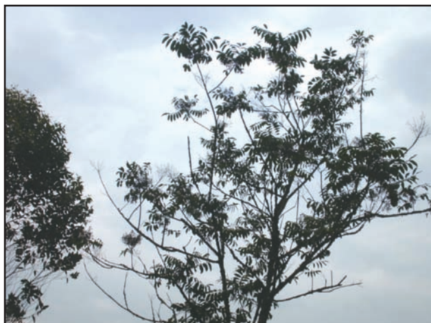
Figura 3. El árbol Toxicodendron striatum “manzanillo” mide unos 4 o 5 metros de alto.