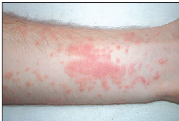
Figura 1. Lesión eritematosa, con vesiculación.

A la familia anacardiaceae pertenecen otras especies de amplia difusión en América Latina como el marañón y el mango. El mango ( Mangifera indica ) contiene pequeñas cantidades de oleorresinas relacionadas con el urushiol y puede producir, en personas sensibilizadas, eczemas peribucales o lesiones en las mucosas de la boca o del sistema gastrointestinal, por el contacto directo (5). El marañón, Anacardium occidentale , también llamado merey, alcayoiba,