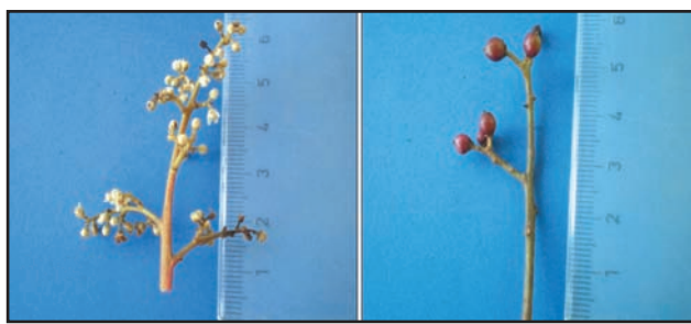
Figura 5. Flores y frutos del “manzanillo”.