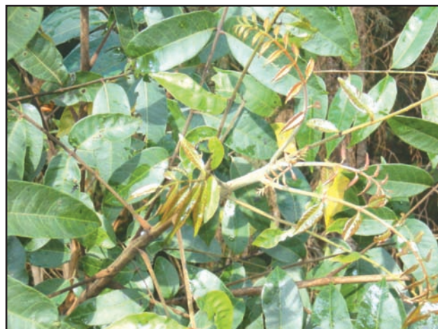
Figura 4. Hojas del árbol “manzanillo”.