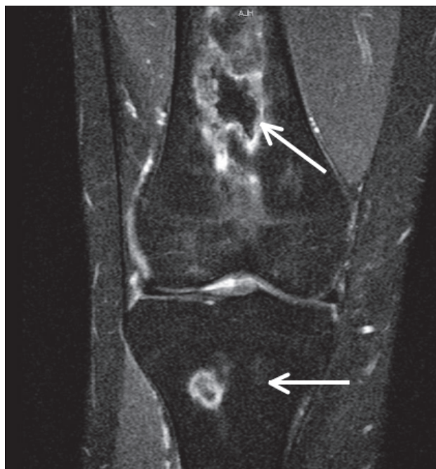
Panel B. Imagen en secuencias de supresión grasa, corte coronal de la rodilla. Las flechas señalan lesiones óseas, de centro isointenso y periferia hiperintensa que corresponden a infartos óseos.

Paciente de 19 años, con diagnóstico de lupus eritematoso sistémico (LES), en tratamiento con corticosteroides, quien consultó por dolor de tres meses de evolución en la rodilla derecha, limitante y sin respuesta a analgésicos, por lo que se realizó resonancia magnética (RM), que mostró lesiones focales óseas, de bordes irregulares, en el aspecto distal de la diáfisis femoral y proximal de la diáfisis tibial; isointensas en T2, en densidad de protones (DP) (Panel A) y en secuencias de supresión grasa (Panel B), con un halo hipointenso en T1 y DP (panel A) e hiperintenso en T2 y en secuencias de supresión grasa (Panel B), indicando infartos óseos.