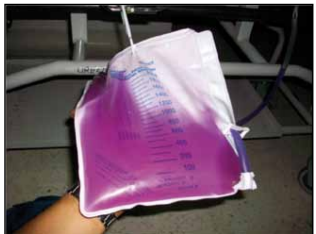
Figura 3. Aspecto de la orina bajo una fuente luminosa.