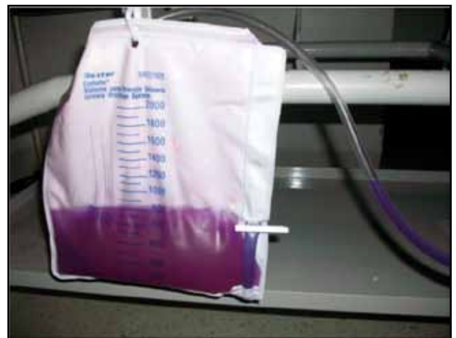
Figura 2. Aspecto de la orina con mayor luminosidad. En el tubo se aprecia más oscura.