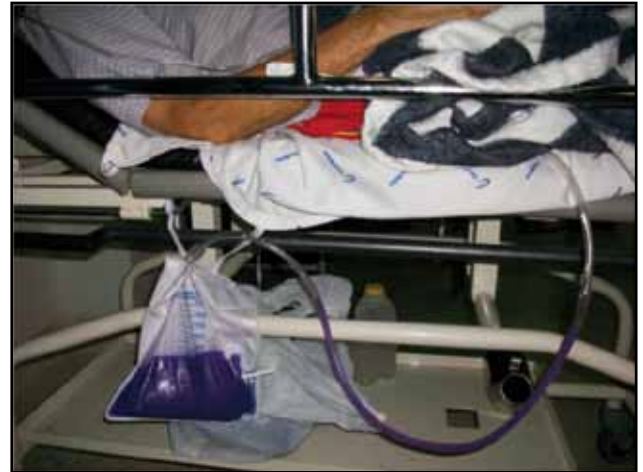
Figura 1. Orina púrpura en el tubo y en la bolsa urinaria con poca luminosidad. Se aprecia un color más oscuro.

El síndrome de la bolsa de orina púrpura (PUBS por sus siglas en inglés) fue descrito por primera vez por Barlow and Dickson en 1978 (2). El contenido de la bolsa para la recolección de la orina puede tomar este color en horas o días después de colocada la sonda vesical, y el color puede ser más intenso entre más días transcurran entre el contacto de la orina con la bolsa, y no sólo compromete a la bolsa sino al catéter (3, 4). Investigaciones han revelado que este