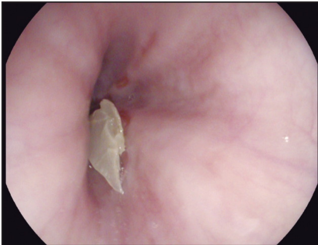
Figura 1. Cuerpo extraño esofágico constituido por material vegetal.

DOI: https://doi.org/10.36104/amc.2019.1330